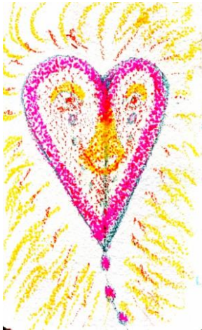
God van Liefde

Naar aanleiding van een overdenking en Jesaja dacht ik het volgende: