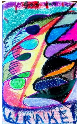
God der Wraake