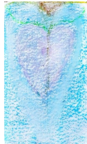
God is Liefde